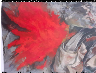
MERCEDES (2016) - Replumons du monde, nous ne pouvons donc pas avoir anti-empire, un exercice du vide /