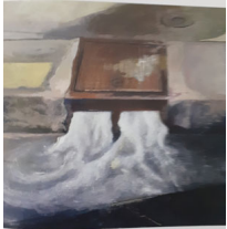
DÉCOUPE (2016) - Points de points et absences de temps, flux sans l'ovale de départ. On voit l'Éclair CHEMIN