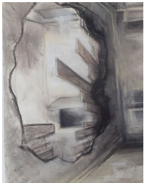
LIAGE TROUÉ (2016) - Abstraction avec de profondes zones d'égout figurante aux bords figurants