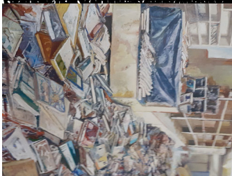
LE TRON PLEIN (2016) - Le verite nous saisit aussi devant le Tron Plein. L'espace est surchargé