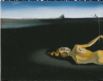
Themes & variations The empire of light © 2014 by the artist. Photo Collection by Massimo Barbero. Aurèle M.