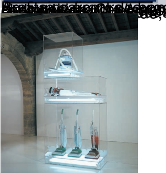
CDRAC fonds régionaux d'art contemporain