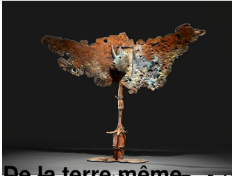
De la terre même