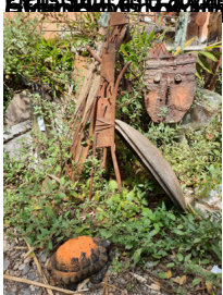
Le travail est très minutieux et demande beaucoup de patience. Les sculptures sont réalisées à la main.