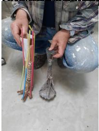
Le travail est très minutieux et demande beaucoup de patience. Les sculptures sont réalisées à la main.