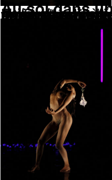
Fania Stojanov Clixix Photos Dalchin www.flexlaboratory.com