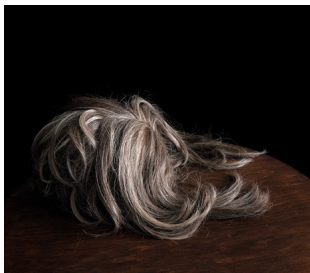
Photo: © Brigitte Lustenberger pour un événement à Québec en collaboration avec le Centre de la culture et de la créativité. / Photo: © Brigitte Lustenberger pour un événement à Québec en collaboration avec le Centre de la culture et de la créativité.

Document communiqué en vertu de la Loi sur l'accès à l'information et sur la protection des renseignements personnels. / Document released pursuant to the Access to Information Act and the Privacy Act.