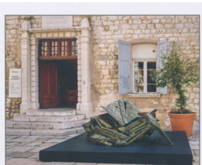
Accord Parfait, série Atlantik, 2004, Plazo en bronze patiné, 115 x 240 x 155 cm.