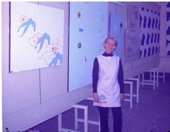
Bernar Venet, Le monde est un jeu , 2019, 1950 Musée d'Art Moderne de la Ville de Paris, Paris

Le monde est un jeu, 2019, 1950 Musée d'Art Moderne de la Ville de Paris, Paris