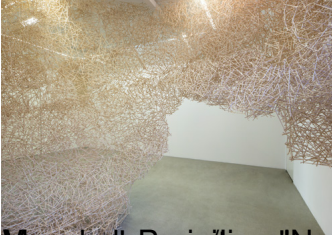
Memento "Position Dési" - Galerie Kamel Mennour, 2017-2018. Une installation dans une salle d'exposition qui agit de manière à susciter une réaction presque