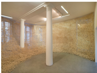
Vue de l'exposition "Nest", Galerie Kamel Mennour, 2017 2018.