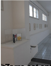
Orto e Mestizo Prigioni, 2017, Busto Arsizio (Va) P. 1 39 346 997849