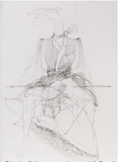
Alchimie, 1995. Graphique sur papier, 100 x 100 cm. © Matthew Barney