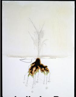
Alchimie, 1995. Graphique sur papier, 100 x 100 cm. © Matthew Barney