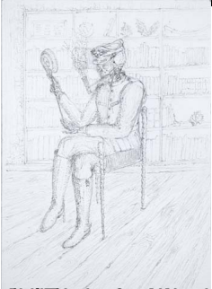
Alchimie, 1995. Graphique sur papier, 100 x 100 cm. © Matthew Barney